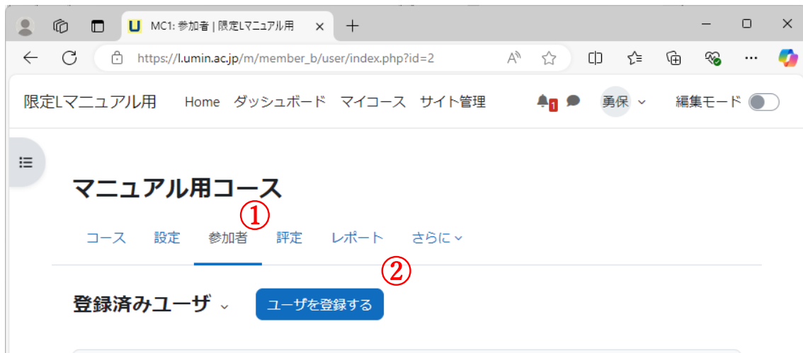
下図 3：コース画面例

作成されたコースの画面から「参加者」（図3①）を選択し、参加者の画面から「ユーザを登録する」（図3②）をクリックします。