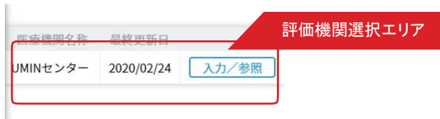
＜評価機関選択画面＞