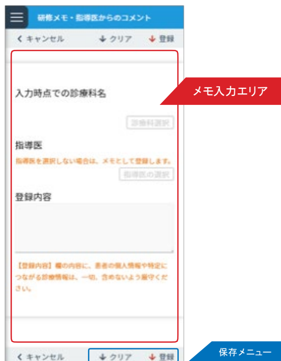
＜新規メモ・コメント入力画面＞