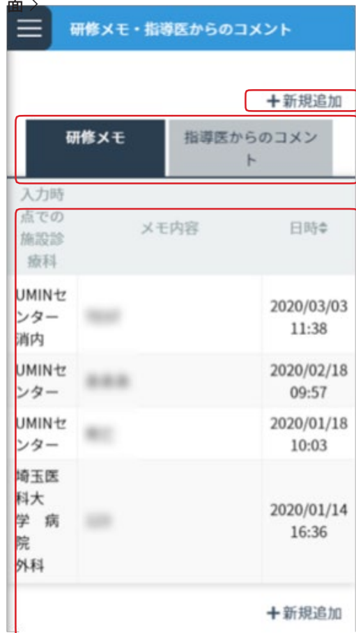
＜研修メモ・指導歯科医からのコメント一覧画面＞